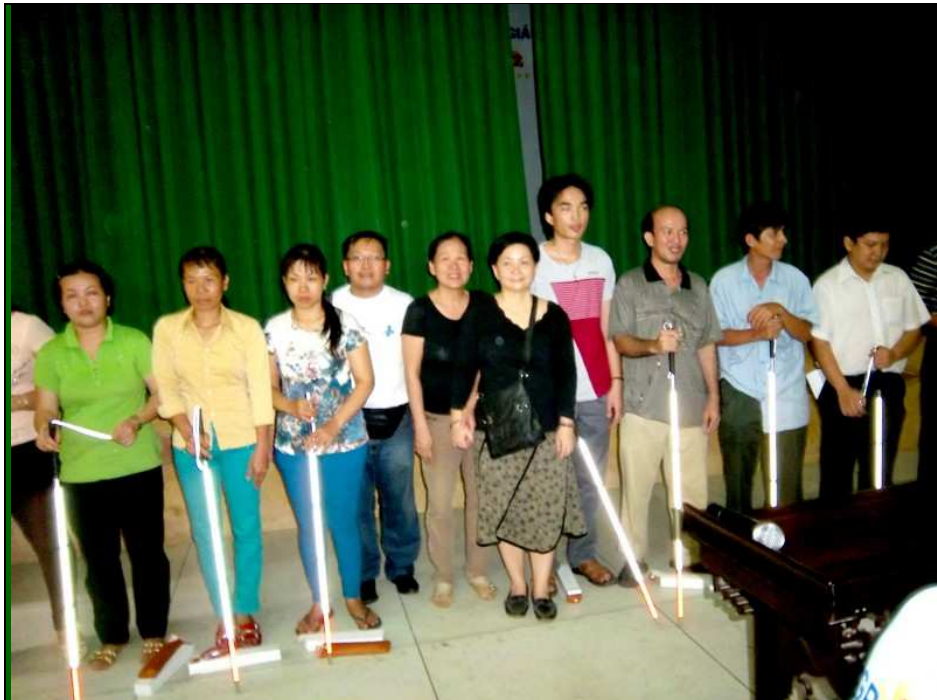
Các em khiếm-thị tại Gò Vấp

Các em chia làm nhiều nhóm, mỗi nhóm từng 4-5 em, và có một hướng dẫn viên chỉ dẫn các thao tác. Các em thực tập và thay đổi thao tác, mỗi em một lần. Bs Cường, anh Delaplace (kiné-ostéopathe) và một số huấn luyện viên đi từng bàn để sửa lại thao tác cho các em.