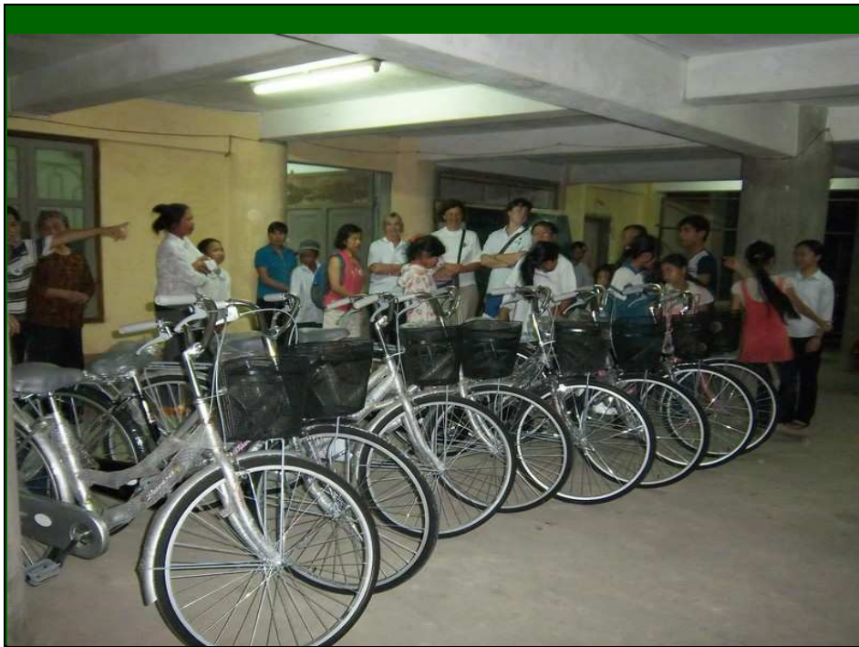
Tặng 20 xe đạp cho học-sinh nghèo ở Ninh-Bình

Ngày 24/4, 23 thành viên (lính mới) được tham quan cố đô Huế và cung đình triều Nguyễn xưa. Tuy chiến cuộc và sự tàn nhẫn của thời gian có làm hư hại, nhưng tổ chức Unesco cũng giúp trùng tu lại rất nhiều.